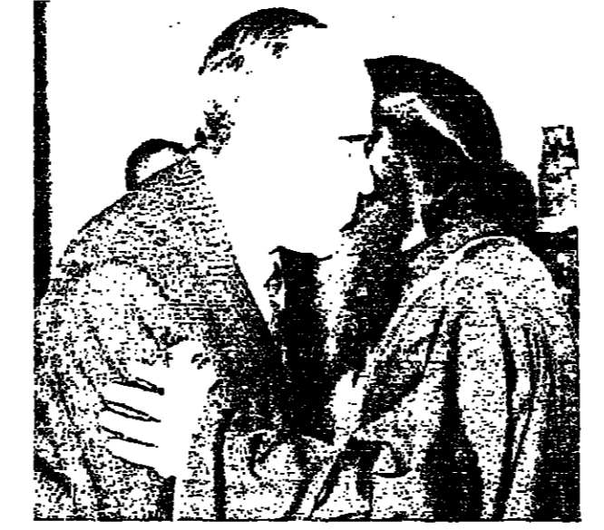
قام الدكتور عبد العزيز حجازي رئيس الحكومة المصرية بزيارة لباريس لشوهد الثلاثين بابا الاسكندرية وبطريق الخطوط الجوية الفرنسية في زيارة رسمية.

هذا، ولا تزال تهديدات كينسجر بغزو دول النفط العربية، تثير ردود فعل غاضبة في مختلف أنحاء العالم. وقد صدرت أمس، تصريحات جديدة في موسكو وباريس وسويسرا، تشكر هذه التهديدات. فقد قالت صحيفة «برافدا» السوفياتية أمس، أنه بعد تقاسم الأزمة في الشرق الأوسط عام 1973، ظهر مرة أخرى الخطر بالنسبة لأوروبا الغربية، في أن تدخل رغم إرادتها في نزاعات تفض مع حياضها هوياتها المتنافسة. وقالت صحيفة «سويتسكايا روسيا» لا يمكن أن نتجاهل تماما حقيقة التهديد بحدوث تدخل أمريكي ضد الدول البترولية. وذكرت صحيفة «أزستيا» السوفياتية الحكومية، أن تصريحات كينسجر تكشف سياسة طويلة المدى توجها واشتغل نحو المواجهة مع الدول العربية المنتجة للبترول. استنكار سويسري وفي برن، انتقد وزير الخارجية السويسري بيير غراي تهديدات كينسجر وقال أنها غير مناسبة. وقال غراي: حتى إذا كان أتق دولة كبرى يختلف جديا عن أتق دولة